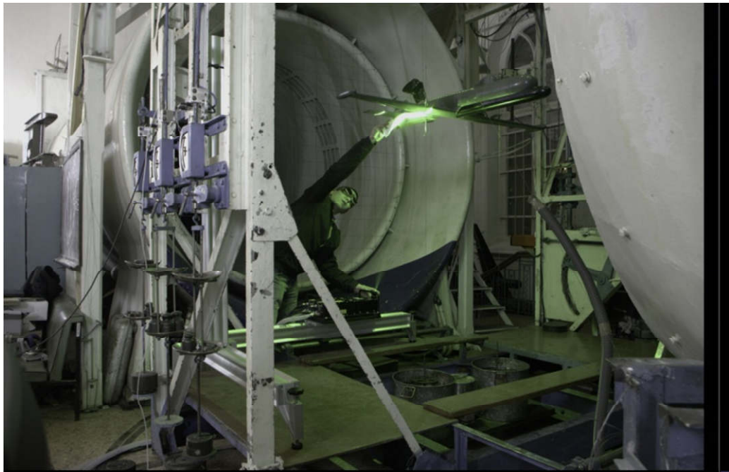
Настройка PIV-системы ПОЛИС